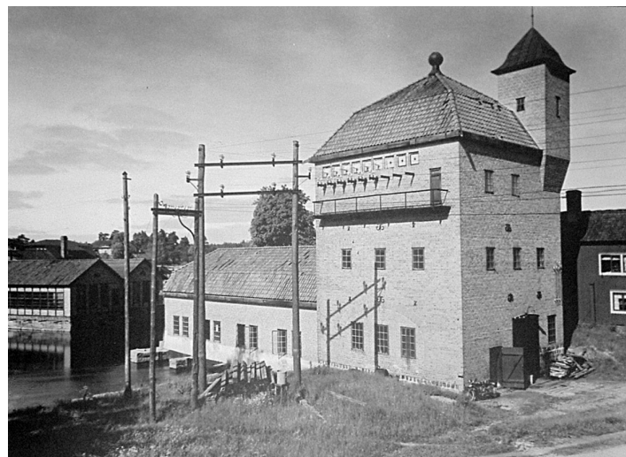
Virskos andra kraftstation före 1920.

Hasselfors och sedan till Bulten-Kanthal 1943. Bulten-Kanthal behöll länge kraftbolaget som så småningom ingick i Bergslagens Gemensamma Kraftförvaltning, BGK. År 1985 byggdes ny station i Virsko. BGK såldes till Västerås stad och namnändrades till Mälarenergi.