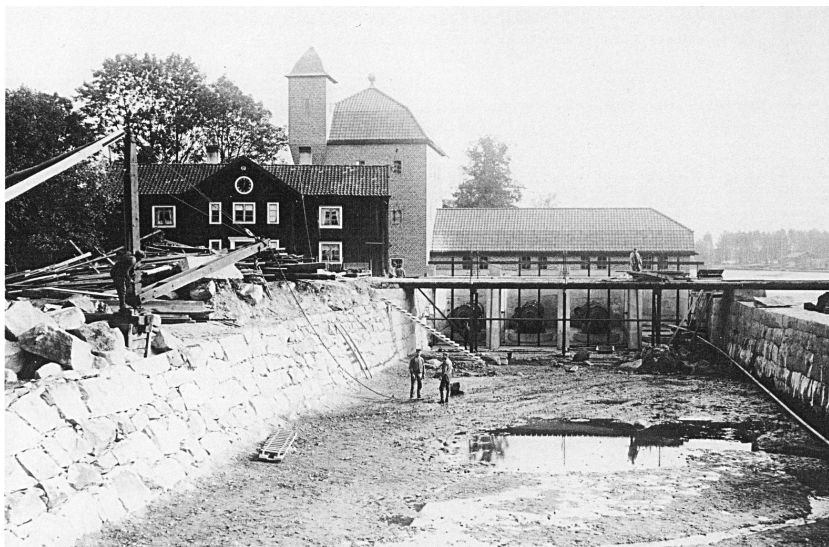
Inloppsrännan till andra kraftstationen under byggnad 1913. Klockbyggnaden låg kvar på sin ursprungliga plats nära kraftstationen och hade kvar klockan.

Den bemannades från kl 04.00 till 23.00 vilket innebar att bruksbefolkningens belysning släcktes kl 23.00. Åtminstone en gång väcktes maskinisten senare och drog på stationen, jag tror det var vid en förlossning.