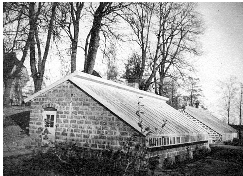
Växthusen i herrgårdsparken.

såldes verksamheten till Konsum att användas som lagercentral för Västmanland till 1990. Det sista växthuset revs 1999.