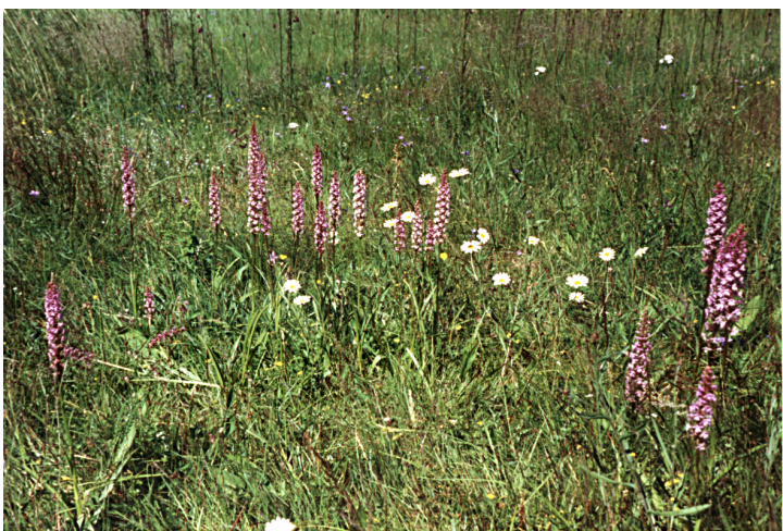
Brudsporrar i kraftledningsgatan efter Färnebovägen i Gammelby, 1995.

Flodkraften försvann med kräftpesten i Virsobosjön redan 1917 men har ersatts av