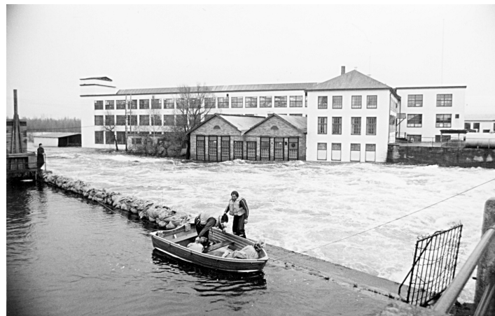
Under 1977 års översvämning tog delar av Kolbäcksån vägen genom rördelsavdelningen.

Kolbäcksån har översvämmat Virsbo 1916, 1924 och 1977. 1677 spolades en hammare och en härd bort.