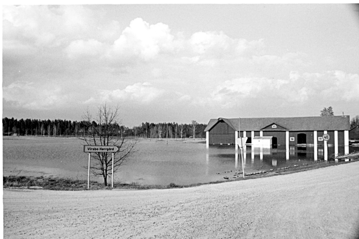
Under 1977 års översvämning nådde Virsobosjön till herrgårdslagården.

även industrin krävde detta. Långt in i modern tid hämtades dagligen källvatten i en 50-litersflaska på kärra från Kvarnängskällan, nu igenlagd, nedanför Tallåsen. Länge hämtades kaffevatten från Lefelingskällan vid Korpfallet. Brännmossekällan några hundra meter från Bruksvägen ansågs ha det bästa vattnet och bars därifrån med ok. Jäkenkärrskällan ligger stensatt några hundra meter norr om korsningen Färnebovägen och Björktjärnsvägen.