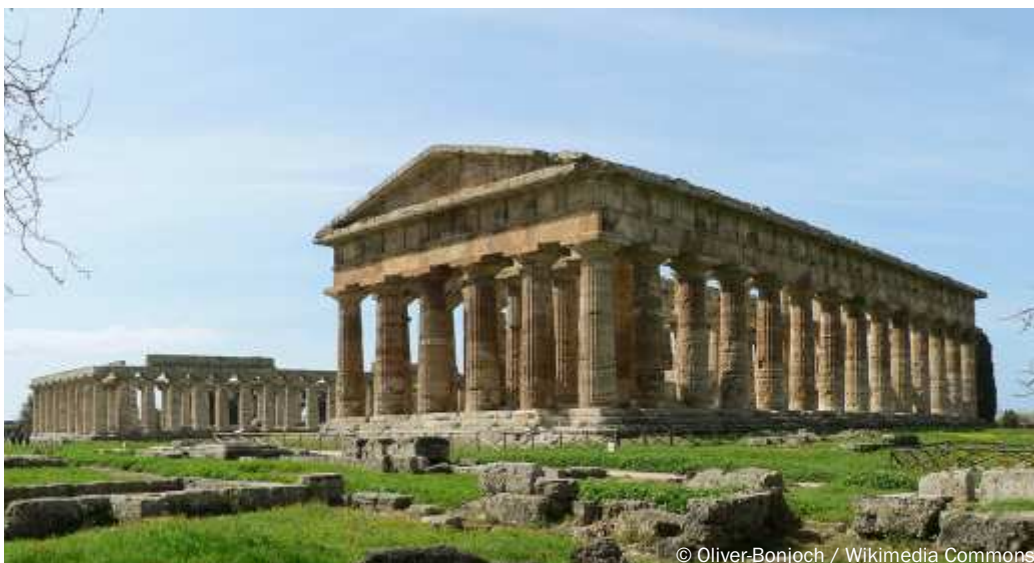
Veduta di Paestum