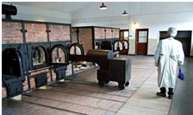
Krematorieugnar i Buchenwald

Mest nöjda i östra Tyskland är pensionärerna. Det bekräftade åter nya opinionsundersökningar som publicerades i tyska tidningar under vår resa.