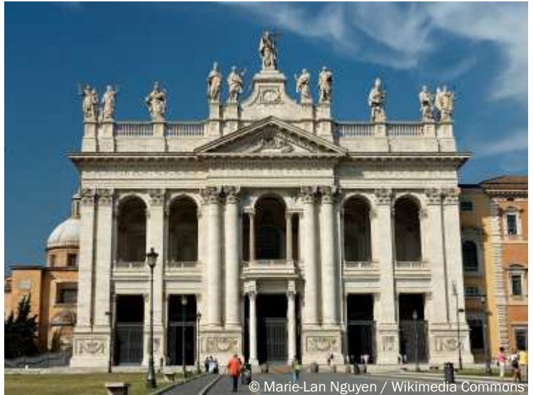
San Giovanni in Laterano