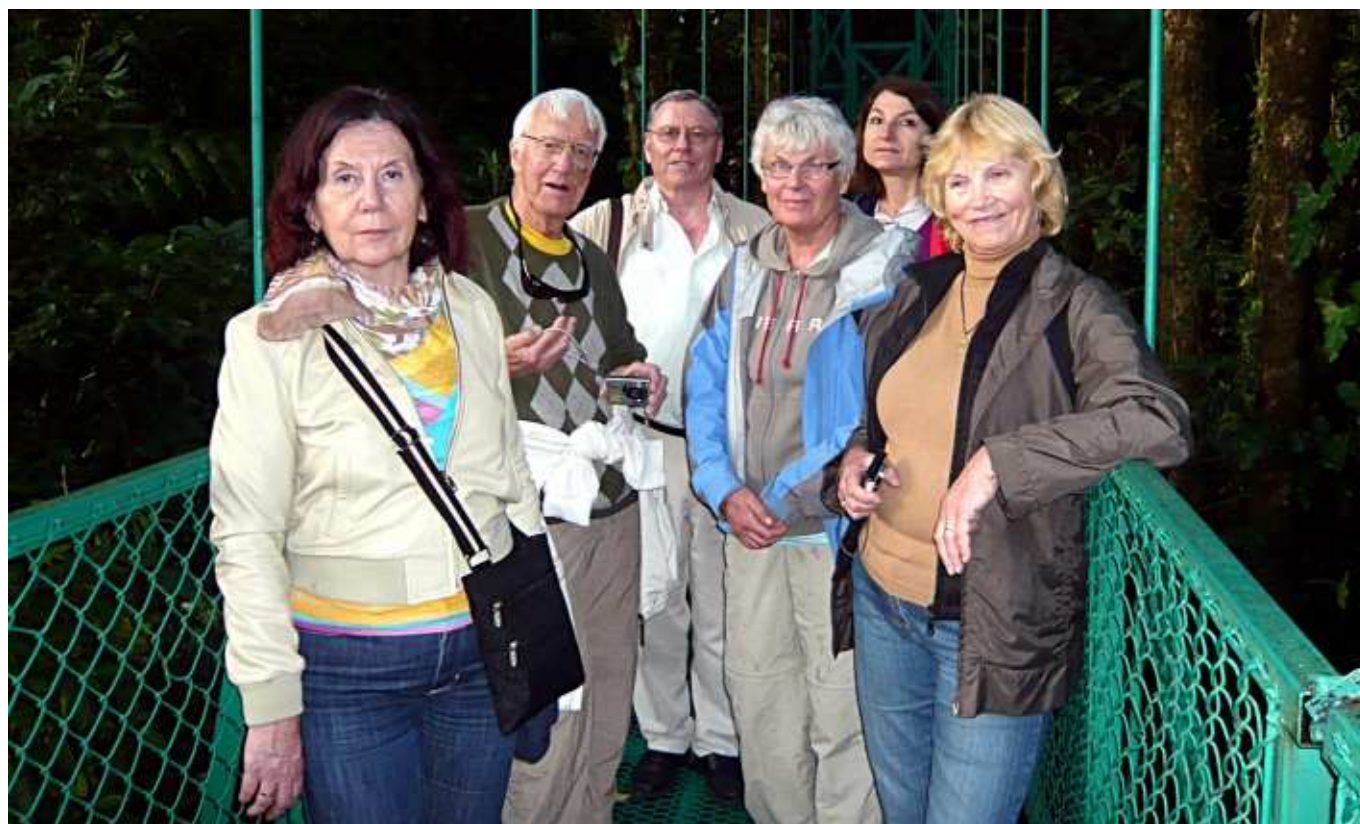
Konferensdeltagare på väg genom regnskogen

Du kan läsa mer om vårt internationella samarbete på iauta.org .